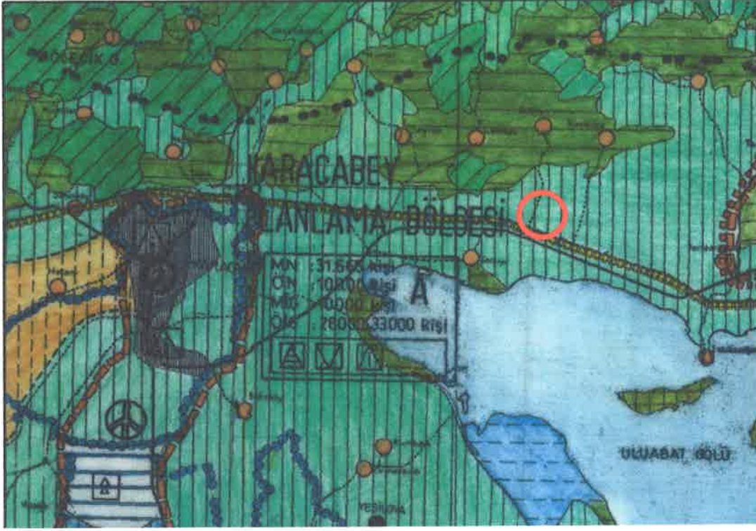
1/100.000 Ölçekli Çevre Düzeni Planı

Plan değişikliği hazırlanan 3496 parsel için hazırlanmış 1/5000 Ölçekli Nazım İmar Planına Esas Jeolojik ve Jeoteknik Etüd Raporu, Çevre ve Şehircilik İl Müdürlüğü'nce 26.09.2016 tarihinde onaylanmıştır. Parselin bulunduğu alan Jeolojik-Jeoteknik Etüd raporunda Önemli Alan 5.1 olarak tariflenmiştir. İnceleme alanında zeminin geneline bakıldığında kohezyonlu zeminin orta katı-katı ve çok katı kıvamda olduğu tespit edilmiştir.