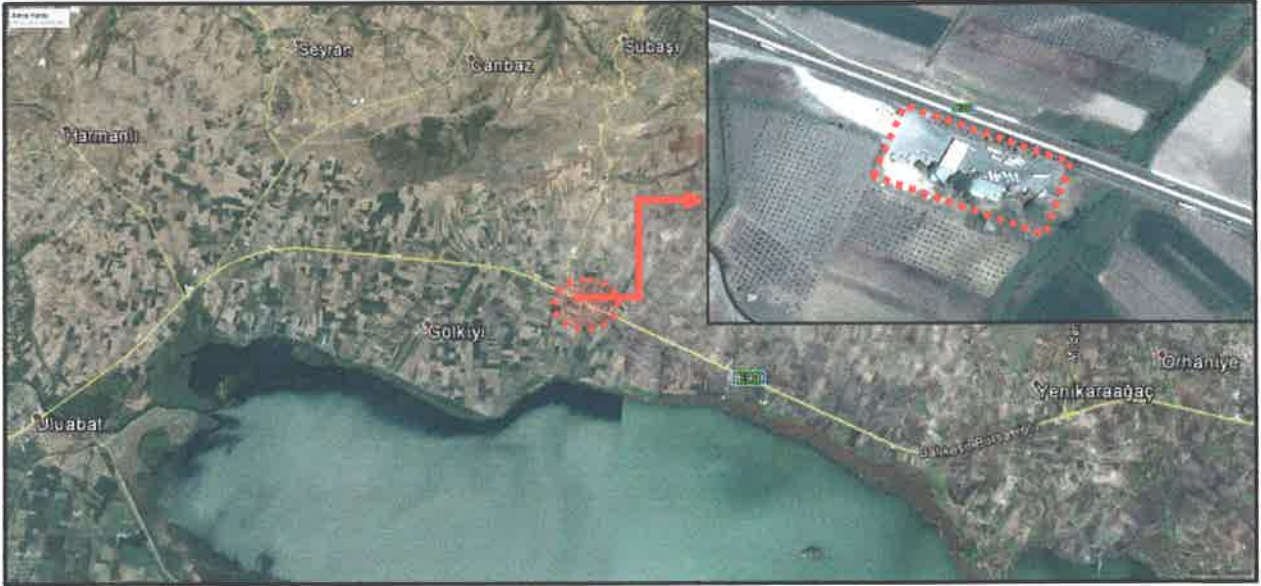
Nazım İmar Planı Hazırlanan Alan

Nazım İmar Planı hazırlanan parseltapu kayıtlarına göre 13.650 m 2 büyüklüğündedir.